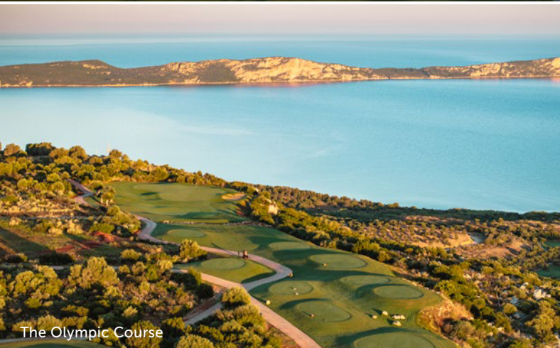
The Olympic Course

Schnell und schwierig ist der Dunes Course, der direkt am Hotel startet. Dort hat Bernhard Langer für Länge und schwierige Grüns gesorgt. Viele Greens sind leicht erhöht und praktisch alle mit Bunkern gut verteidigt. Besonders spektakulär ist die Bahn 2, wo man parallel zum Hotel Richtung Meer spielt.