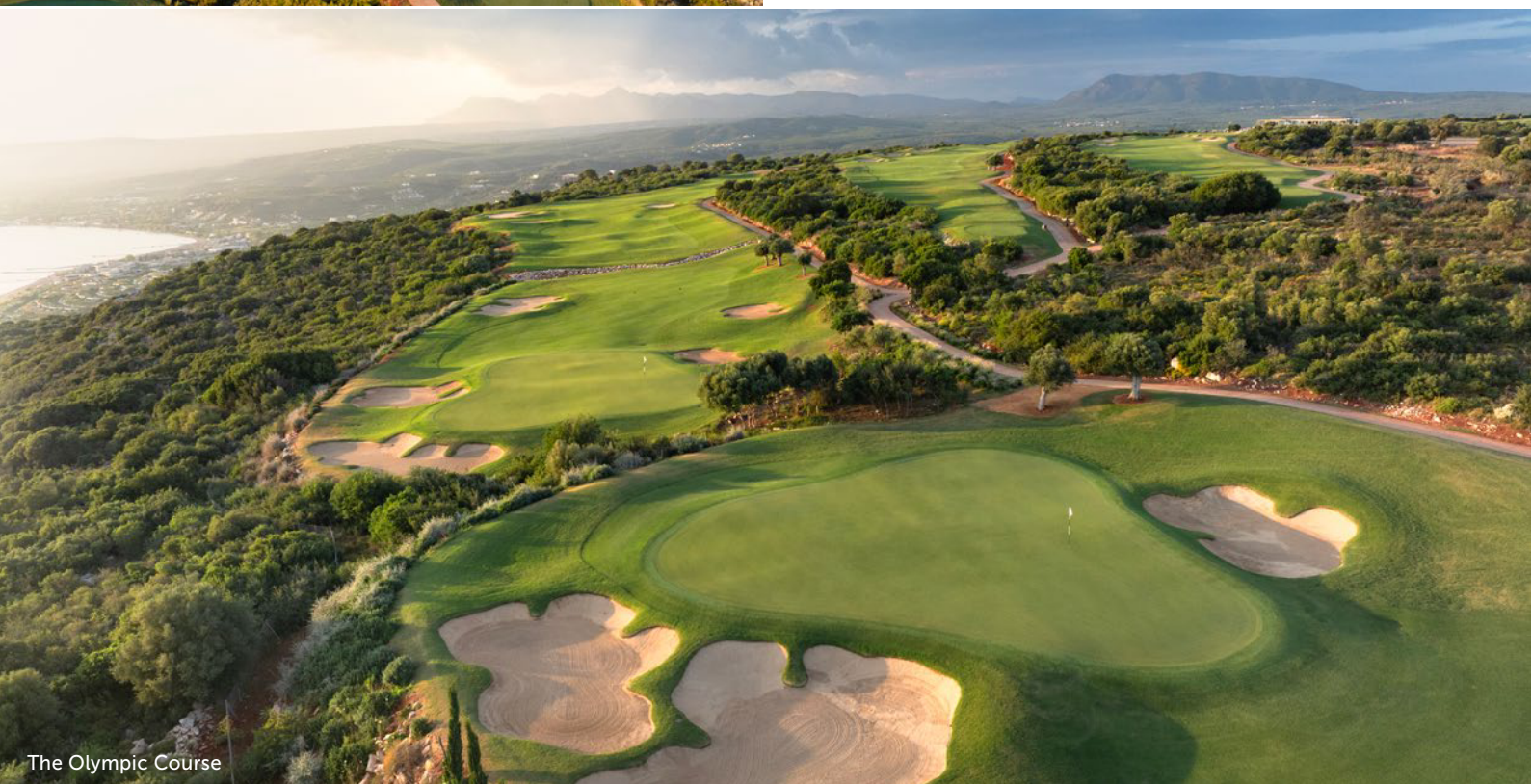
The Olympic Course

Der neue Golfplatz in Costa Navarino thront über der Küste des ionischen Meeres, mit einem atemberaubenden Panoramablick auf die historische Bucht von Navarino. Einige Löcher liegen direkt an den Klippen. Mit etwa 60 Bunkern ist dieser Platz eine Herausforderung für Golfer aller Spielstärken.