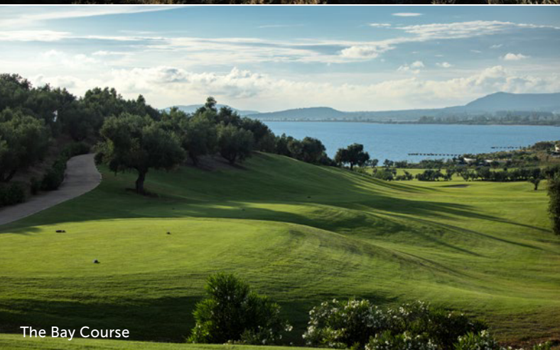
The Bay Course