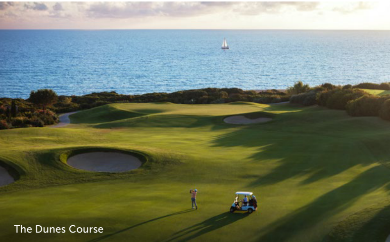
The Dunes Course