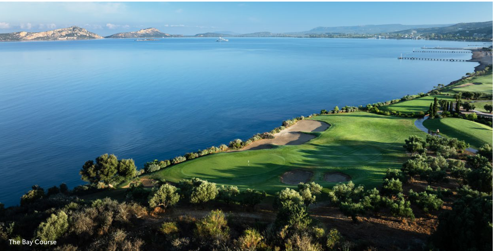
The Bay Course